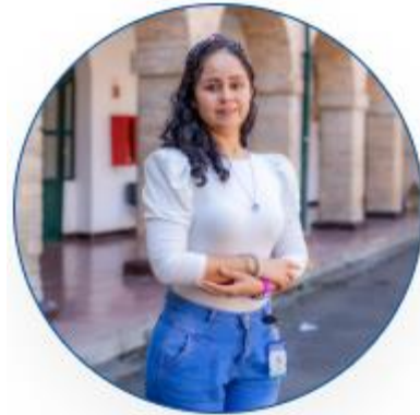
Fuente: FUP (2023)

Los administradores de empresas pueden contribuir al bienestar de la sociedad en un mundo cada vez más globalizado y diverso por medio de la Responsabilidad Social Empresarial (RSE). En un mundo donde las empresas tienen un impacto significativo, la RSE implica un compromiso ético y estratégico con prácticas comerciales que beneficien a la comunidad, el medio ambiente y las partes interesadas. Esto va más allá de las ganancias financieras y se enfoca en crear un impacto positivo sostenible. No solo mejora la reputación de una empresa, sino que también puede generar un cambio significativo en la sociedad, destacando así su papel crucial en la promoción del bienestar colectivo.